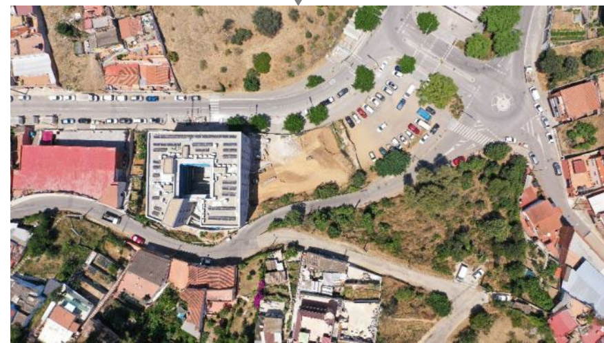
Vista aèria de l'àmbit a urbanitzar