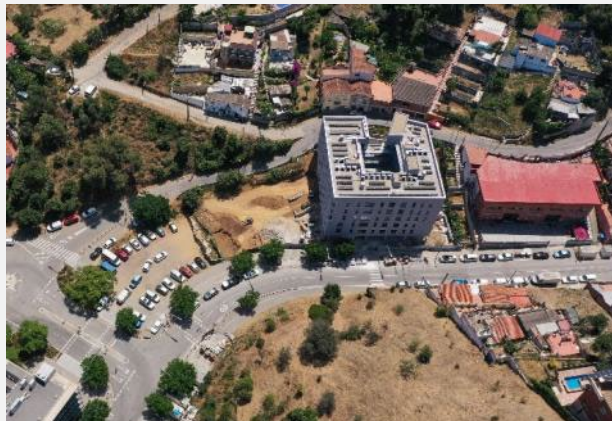
Promoció d'HPO en execució